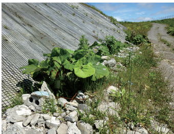
▲廃棄物処分場内の様子

備蓄計画に沿った食数を揃え、各保管庫の在庫一覧も備える必要がある。賞味期限切れ備蓄品は有効に使用するべき。