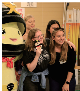
マードック大 北星学園大生 来訪

7月14～18日、4泊5日間の日程でオーストラリアにあるマードック大学から12名、北星大学から5名が天塩町を訪問しました。大学生たちは観光学を専攻しており、持続可能な観光をテーマに、天塩町の文化を実際に体験することを通じ地域の魅力を国際社会に発信していくことを狙っています。