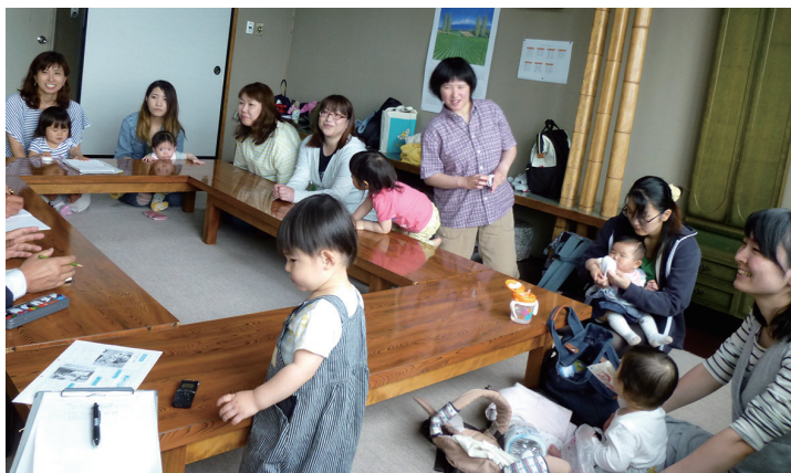
▲元気いっぱいの子どもたちとお母さん (社会福社会館 和室)