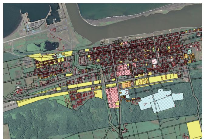
▲天塩市街地区の町有地（白抜き）