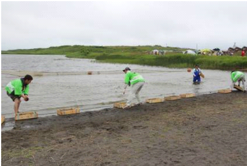
まつりの目玉イベント「しじみ狩り」の準備をするスタッフ一同。