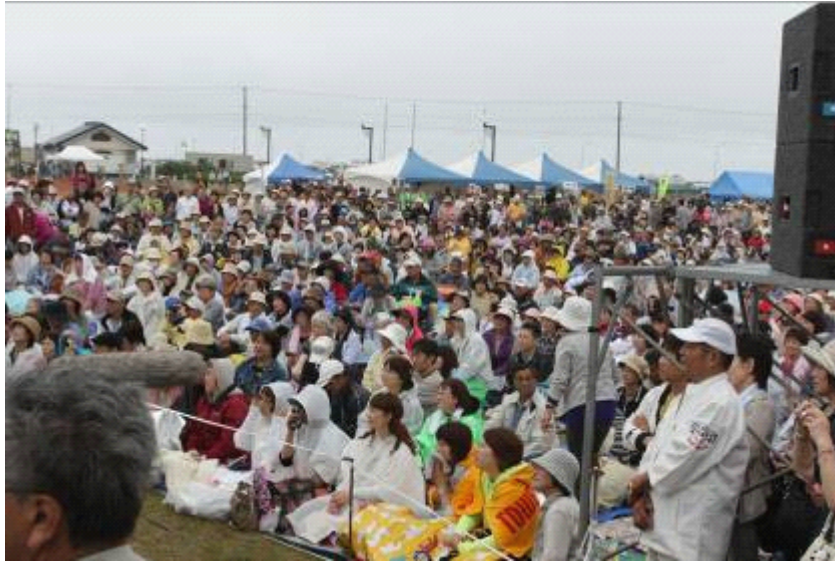
多くの来場者に驚きました。