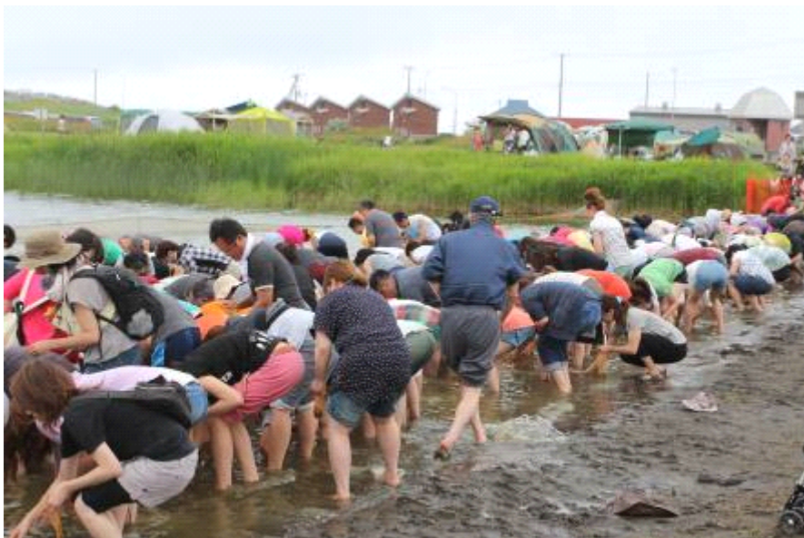
しじみ狩り大人の部 やはり迫力があります。皆さんしじみに夢中でした。