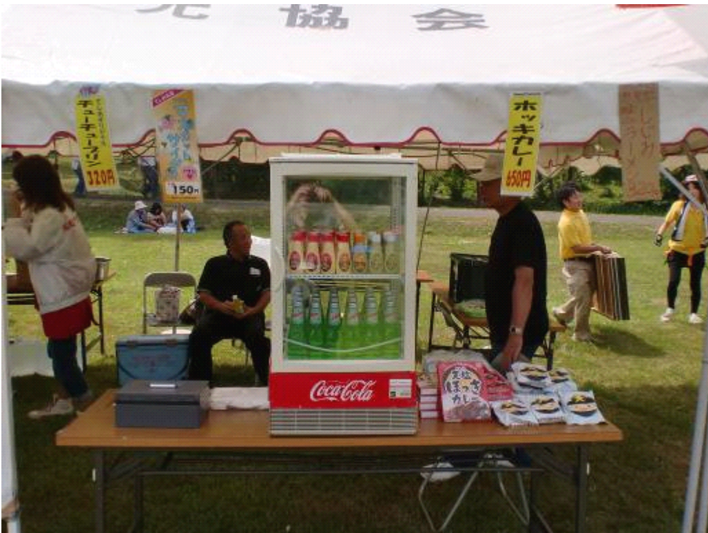
岩尾内湖水まつりの様子 天候に恵まれ強い日差しの中での活動でした。 天塩町の特産品の販売や天塩町のPR活動を行いました。