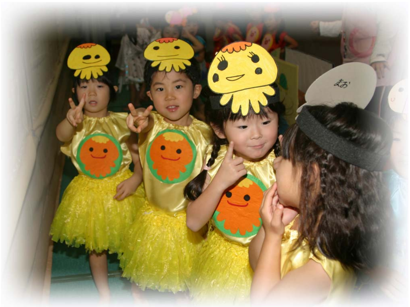
本番直前の舞台裏（天塩保育所お遊戯会）／平成19年11月4日撮影