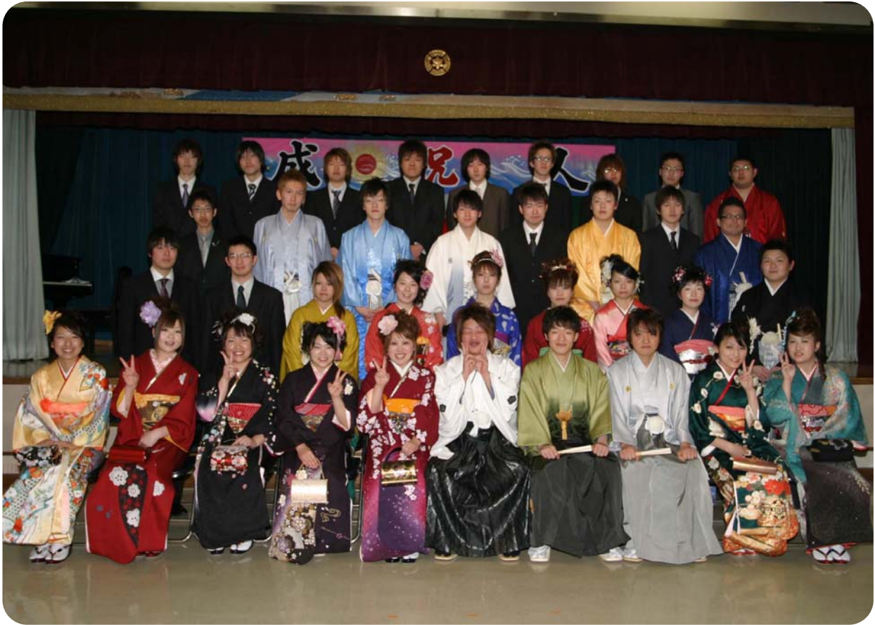
天塩町成人式 (平成22年1月10日撮影)