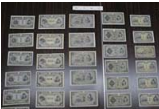
税関で保管している紙幣

返還の請求はご本人だけでなくご家族の方々でも構いません。『もしかしたら家にも…』とお気づきの方は、お気軽に最寄りの税関までお問い合わせください。