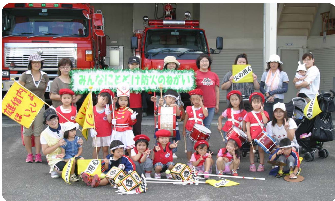
天塩町幼年消防クラブ防火歩行パレード【雄信内地区】（平成24年9月14日撮影）