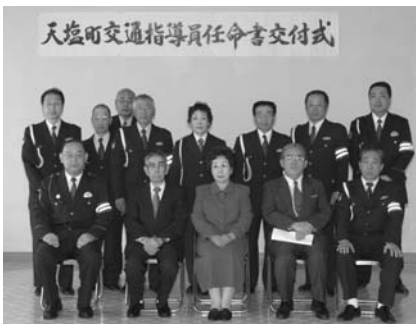
天塩町交通指導員任命書交付式