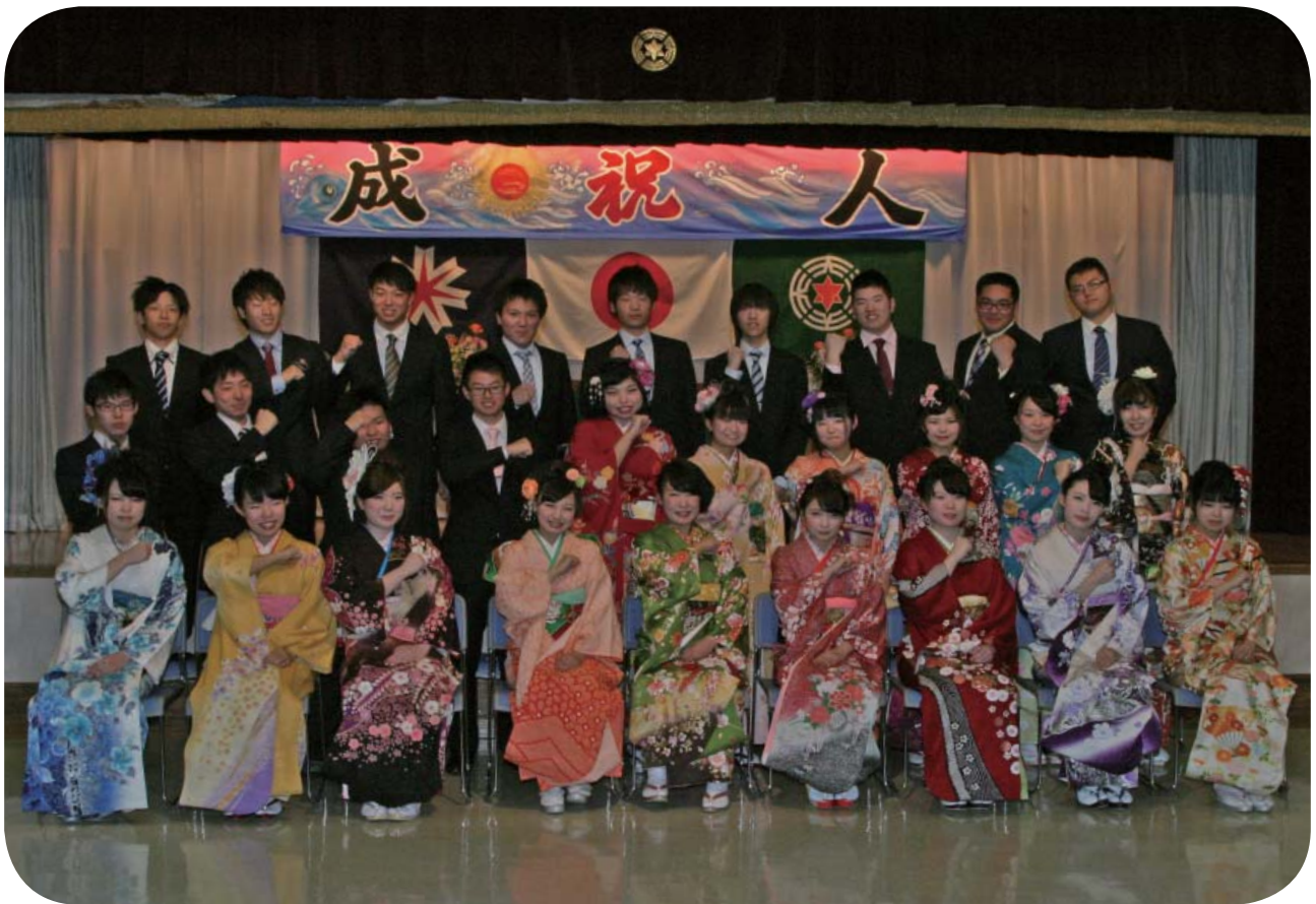
天塩町成人式（平成 27 年 1 月 11 日撮影）