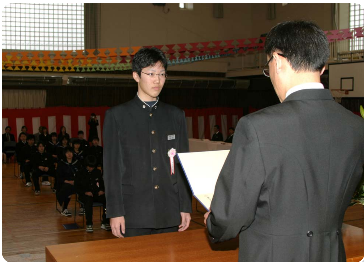
啓徳小中学校卒業証書授与式／平成20年3月14日撮影