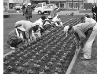
▲フラワーフレンドリーによるミレニアムパーク花壇整備

また、留萌開発建設部のボランティア・サポート・プログラムの一環として、商工会女性部が5月30日に、道の駅でしおにて植栽作業や周辺の清掃ボランティアを実施しました。