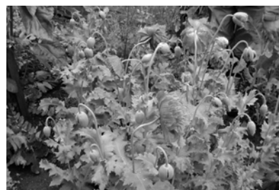
不正けしの一部 ソムニフェルム

掲載を希望される方へ 8月号に掲載を希望する方は7月11日（火）までにお知らせください。