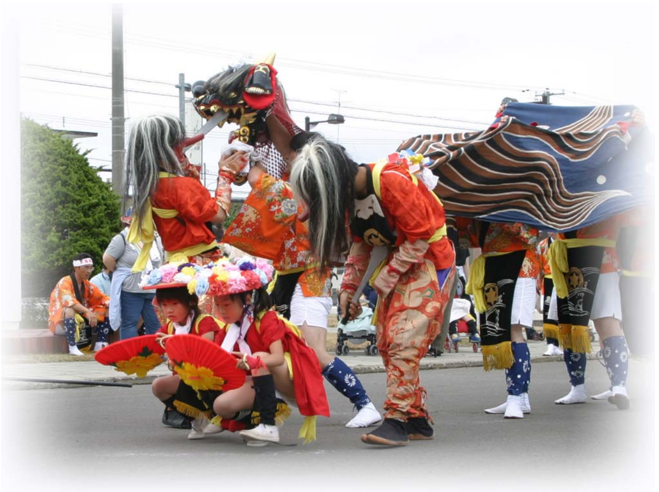
巖島神社例大祭 越中獅子舞／平成19年7月17日撮影