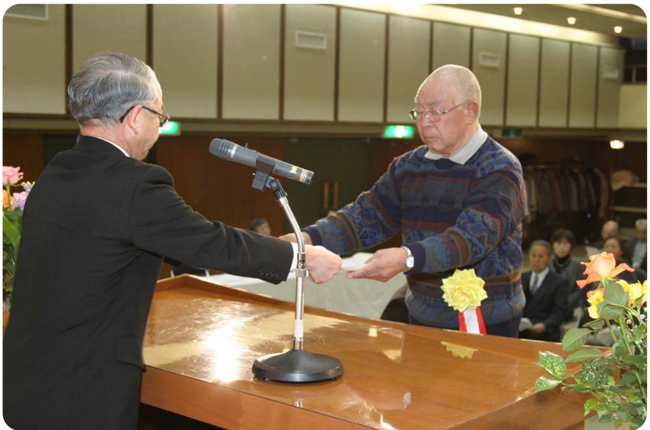
はまなす学園卒業式(平成23年3月4日撮影)