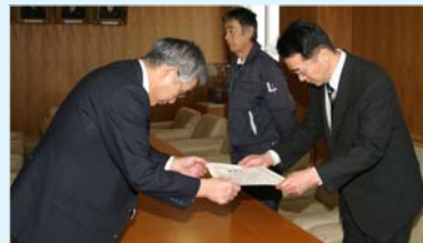
鹿兒島建設株式会社