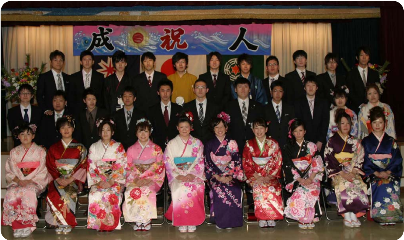
天塩町成人式(平成23年1月9日撮影)