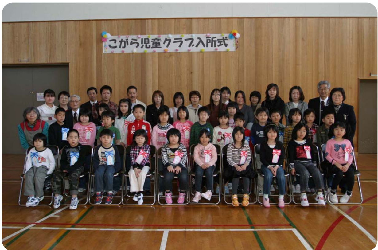
こがら児童クラブ入所式 (4月2日撮影)