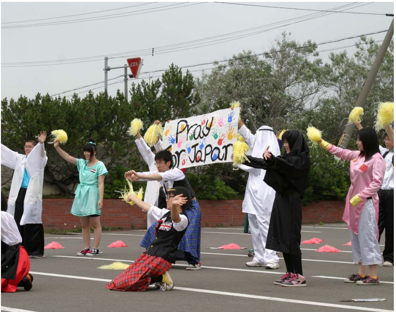
天塩高校学校祭パフォーマンス(平成23年7月9日撮影)