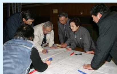
災害図上訓練の様子

その後、AEDの使用法の訓練も行われ、住民は真剣な表情で訓練に臨んでおりました。