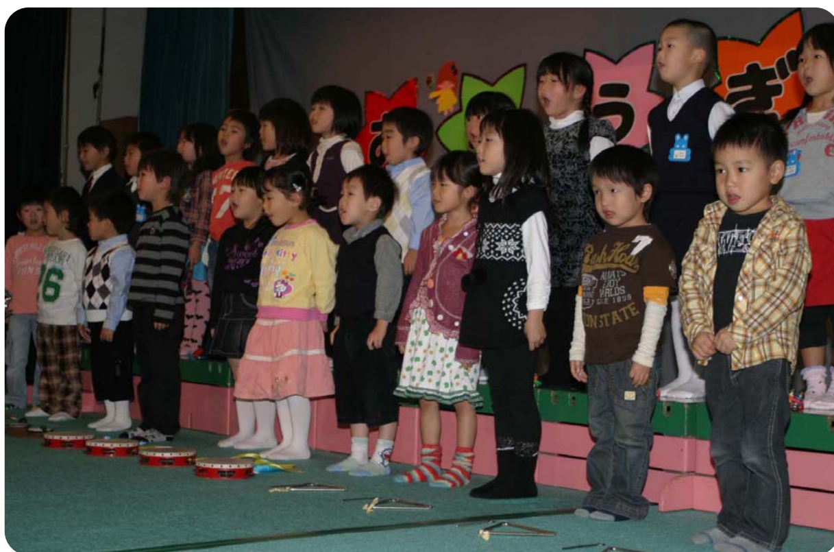
天塩保育所お遊戯会（11月2日撮影）