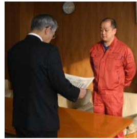
鹿児島建設株式会社