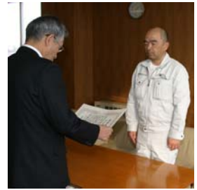
株式会社道北土木