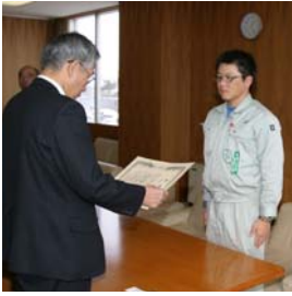
道路工業株式会社