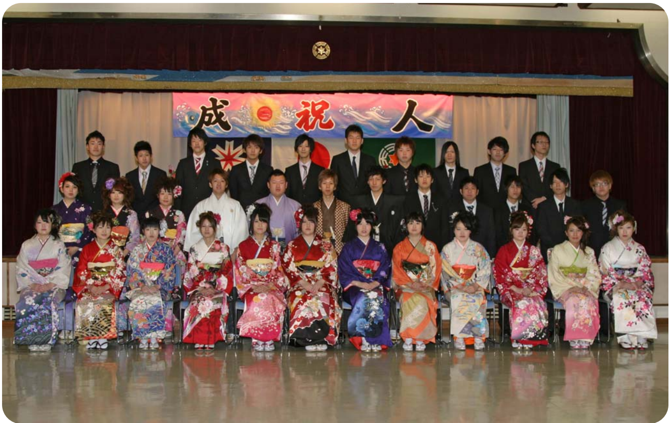
天塩町成人式（平成25年1月13日撮影）