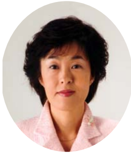
北海道知事 高橋はるみ