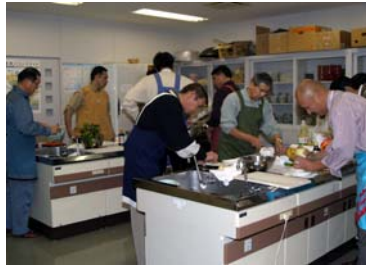
▼警察官による料理教室