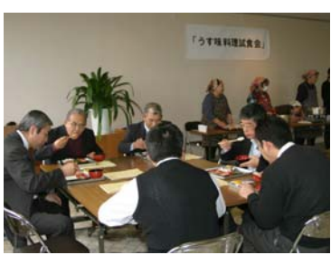
▲役場内で行われた料理試食会