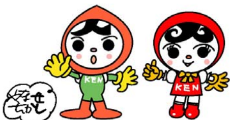
人権イメージキャラクター 人KENまもるくん 人権イメージキャラクター 人KENあゆみちゃん