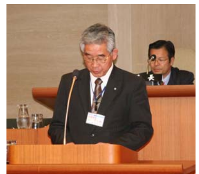
執行方針を述べる浅田町長

地域の活性化を進めていくにあたりましては、商工団体や関係機関との連携が非常に重要でありますので、商工業の活性化と経営安定を促進していくため各種助成制度の活用支援、商