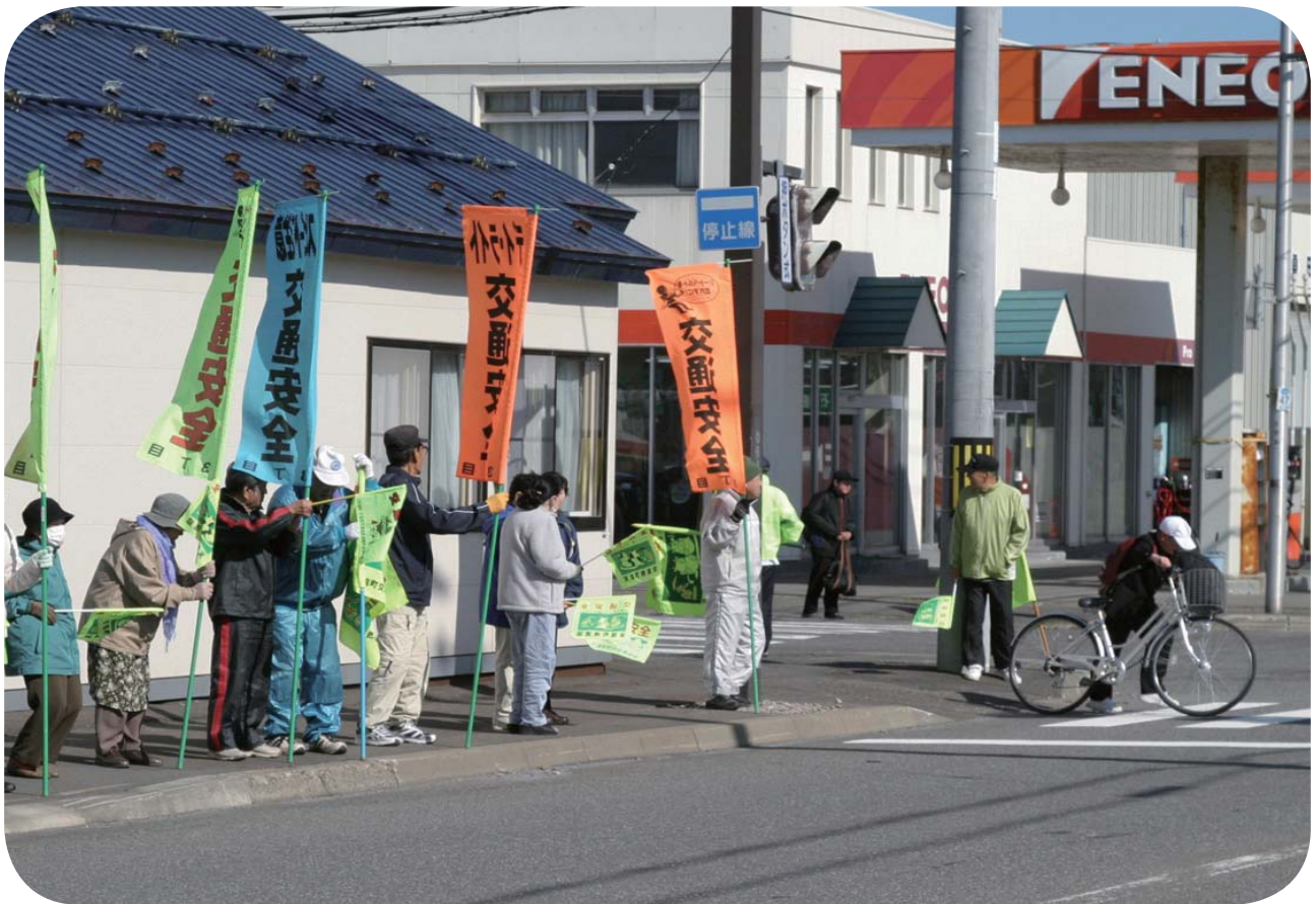
春の交通安全運動（平成 27 年 5 月 15 日撮影）