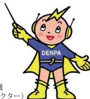
デンパ君 (電波利用環境保護 マスコットキャラクター)