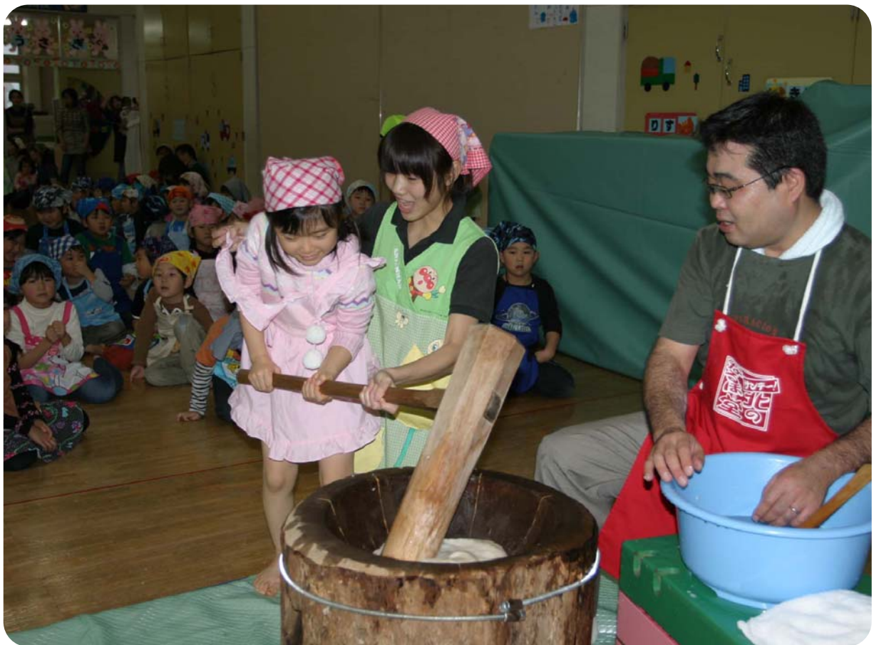
天塩保育所もちつき大会（12月5日撮影）