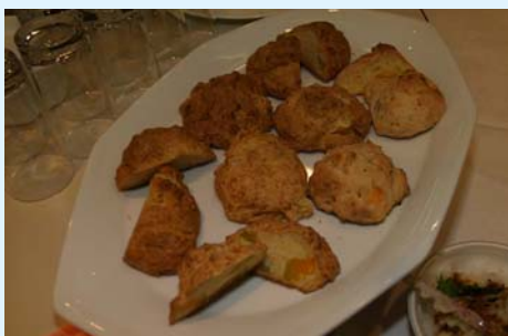
※実習で作ったかぼちゃパン