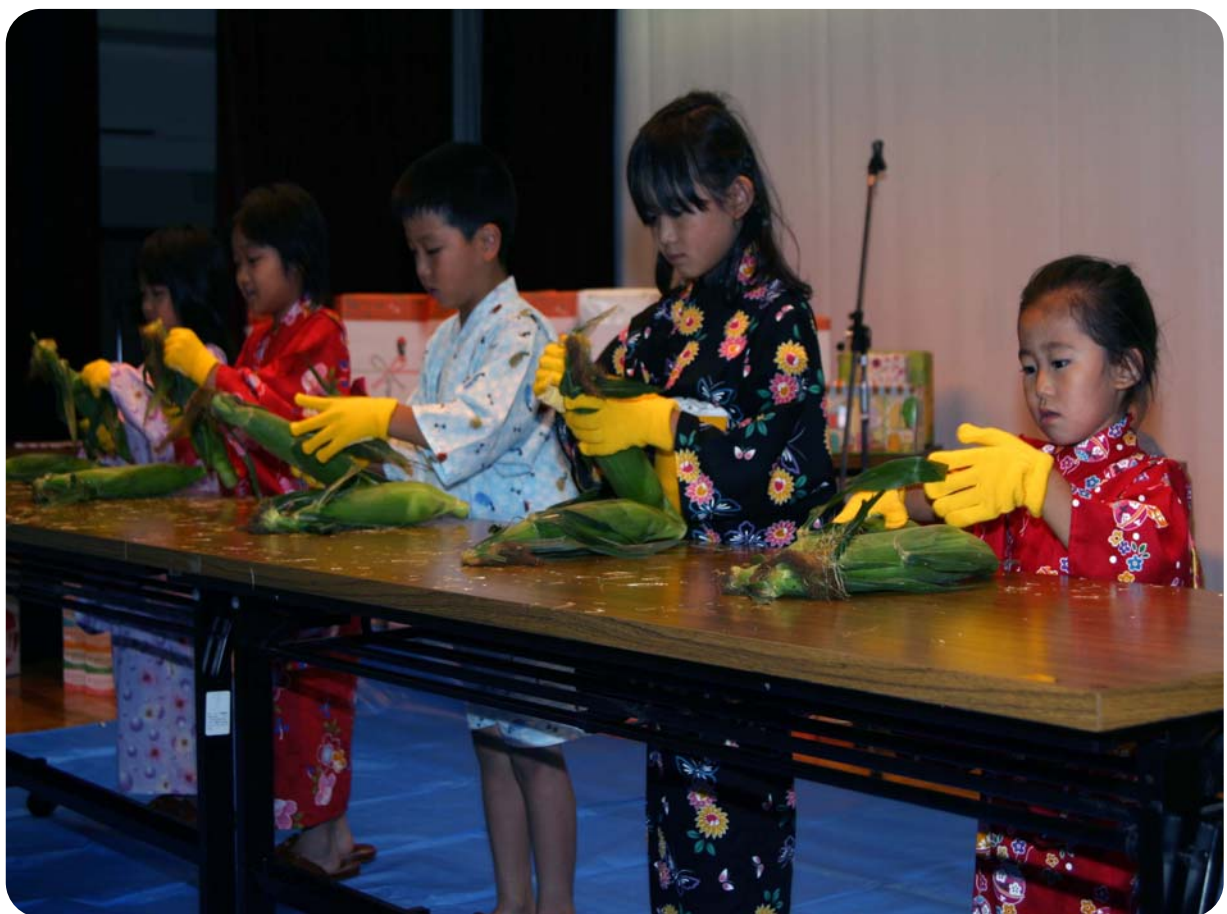
第20回雄信内夏まつり（とうきびの早むき競争）