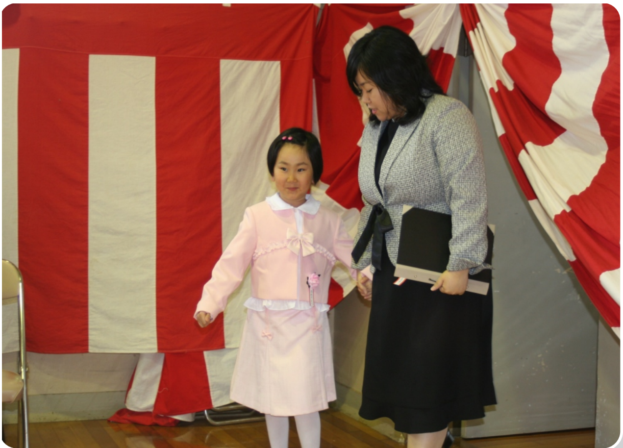
更岸小学校入学式／平成20年4月6日撮影