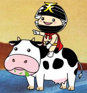
題字背景・イラスト画: sakko