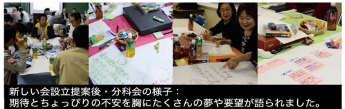
新しい会設立提案後・分科会の様子：期待とちょっぴりの不安を胸にたくさんの方の夢や要望が語られました。