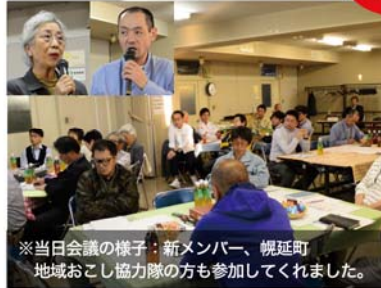
※当日会議の様子：新メンバー、幌延町地域おこし協力隊の方も参加してくれました。