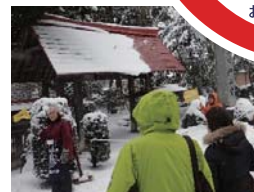
駆け足ながらも密度濃い交流ができました。