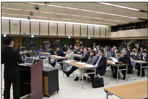
▲説明会に参加する住民と報道陣

この地方都市専用サービスは、日本初の試みとなり、交通手段が不足している地方の新たな交通手段として注目が集まり、多くの報道陣が詰め掛けていました。