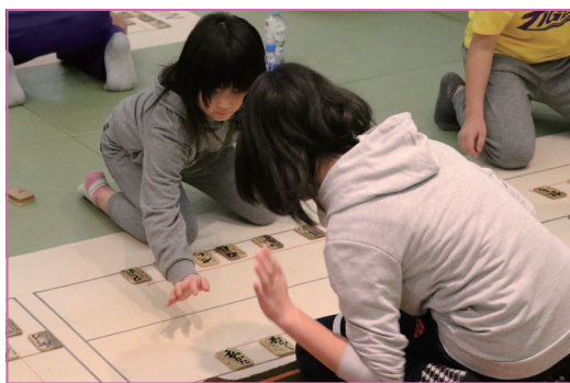
▲札に勢いよく手を伸ばす子どもたち