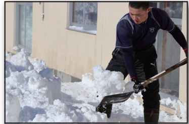
▲除雪ボランティアで汗を流す高校生

作業を行った場所は、町社会福祉協議会を通じ、要望があった高齢者等が入居する山手裏通12丁目周辺の公営住宅等で。ベランダなどの雪を丁寧にスコップで掻いて、スノーダンプで運び、終了後は綺麗な道が開けていました。