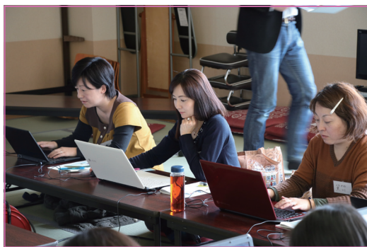
▲ランサーズへ登録する参加者