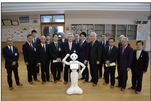
▲ポーズを取る Pepper と西天北五町の町長ら

今般、天塩町が主導として同プロジェクトの選考に応募し、道内で唯一3年間の無償貸与を受けることになりました。今後、Pepperを通してプログラミング授業等を行い、東京都で全国大会のコンテストが行われる予定です。