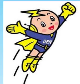
～デンバ君～ （電波利用環境保護 マスコットキャラクター）