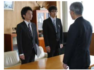
平成25年4月1日 委嘱状交付式