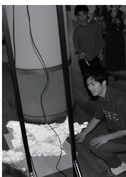
▲レゴマッピングを説明

また、筑波大学生から調査研究に基づき道の駅活性化プランを発表。道の駅が町外の方の利用が多い一方で4分の3が通過型であると指摘し、ライダーがそのまま乗り入れできるスペースでの提案をしました。このほか、北海道の地