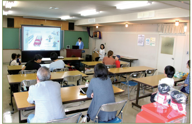
▼読み上げ機能を使って英語絵本の電子書籍を体験する来場者

町社会福祉会館にて8月19日に電子図書館体験会が開催され、約30名が来場しました。 体験会では、導入事業者であるメディアドゥの担当者が使用説明のスタンプで参加しており、登録した方には当日限定のてしお仮面グッズなどが当たるガチャガチャ券が配布されるなどのイベントが行われました。 リードアロング(読み上げ機能)を利用した読み聞かせ会は、図書ボランティアの日本語を合わせ実施されました。終了後のアンケートには「利用方法が具体的にイメージできた」「料理本などの実用書も気軽に利用できて良い」との声が寄せられました。