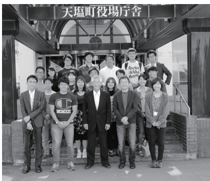
▲研究・調査で来訪した筑波大学生ら

「地方創生プロジェクト紹介」では、町が取り組む地方創生事業を紹介しています。事業紹介にあたっては、各事業の実施内容や今後の展開、事業にかける思いなどを掲載しています。ご質問やご意見などありましたら総務課地方創生係（☎内線271）までお問い合わせください