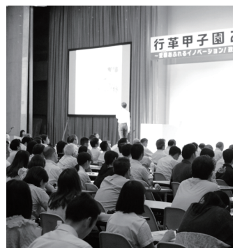
▲行革甲子園での事例発表

団体の発表事例として選定され優秀賞として表彰受け、審査員から「過疎が進んで公共交通に課題のある自治体には優位性がある取組」と高い評価を得ました。