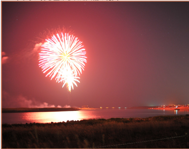
▼2年ぶりに打ち上げられた大輪の花火

2年ぶりの花火大会 新型コロナウイルス感染症の影響により、大きなイベントが中止となるなかで、天塩町観光協会では、昨年からのコロナ禍で沈みがちな気分になつていいる町民にエールを送り、同感染症の収束を祈念するため、2年ぶりとなる花火大会を実施することとなりました。混雑や密による新型コロナウイルス感染症の拡大防止の観点から、町内在住の方のみを観覧対象とし、事前に打ち上げ時間と場所を非公表として8月15日の夜、天塩川河口の夜空を染め上げました。