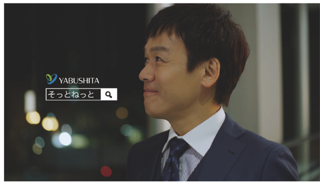
▲ テレビCM放送中の「そっとねっと」

今後より加速していく高齢化社会へ向けて、天塩町に一人でも暮らす高齢者の方が安心して暮らすことができるような町を目指し、AI見守りサービス「そっとねっと」の実証実験を来年3月末まで行います。 「そっとねっと」はご家庭の分電盤に設置する電力センサーがテレビや炊飯器などの家電の使用状況をリアルタイムで分析、見守りに活用します。長時間家電の利用が無い時など生活の異変を察知し、スマートフォンにお知らせしてくれるサービスです。 主に離れて暮らす家族が安否確認のために利用するサービスとして今年1