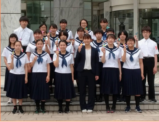
▼全道大会で銀賞を受賞した天中吹奏楽部員