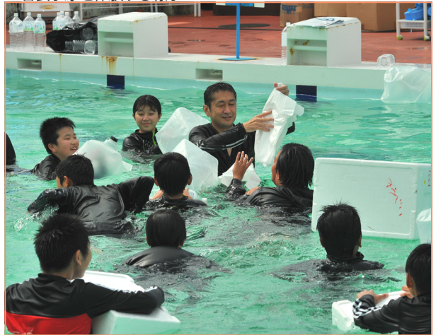
▼着衣水泳を体験する様子

着衣水泳教室 9月1日、町営プールにて「着衣水泳教室」が行われ、町内の小学6年生21名が参加しました。水辺でボール遊びをしていた二人組のうちの一人がボールを追いかけているうちに誤って落水し、溺れそうになっているところをもう一人が助けに行つて二人とも溺れてしまう寸劇を行いました。水の中に落ちてしまったら「慌てずに、浮いて、待つ」と、溺れている人を見つけたら一人で助けにいかず、声をかけ、身の回りにある浮く物を投げる」という教訓を伝えました。生徒たちは着衣したまま水中でペットボトルやゴミ袋を利用して体を浮かせることを体験しました。