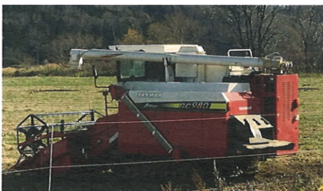
▲小麦用コンバイン

近年、有資格者の募集は行っていますが、採用には至っておりません。道や建設関係者の協力を得ながら、定年退職する年齢の方の採用も視野に含めて人材を探していきたいと思っています。