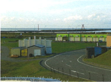
鏡沼の全体計画を検討中

町 各施設の修繕やサービスセンターの撤去移設による会場配置などを含めた全体計画を検討中。利用者減少対策として、てしお温泉夕映との共同企画の検討や、管理運営を民間委託できないかも検討中。