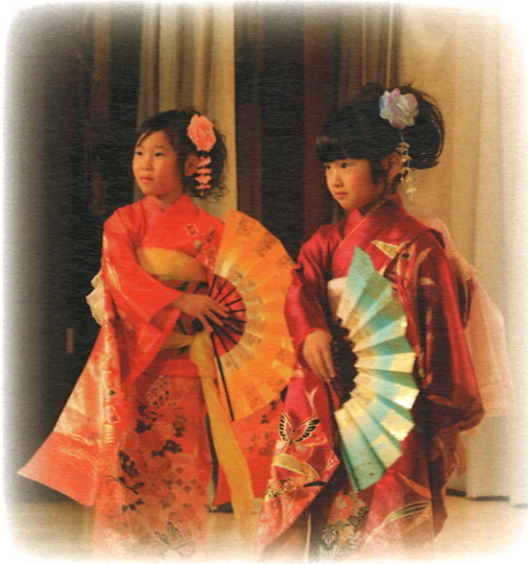
町民文化祭 舞踊「二輪草」

町民文化祭舞台発表会は毎年10月に天塩町文化連盟の主催で行われる行事で、約100名の演者たちがお遊戯やカラオケ、詩吟、ダンス、和太鼓、吹奏楽など様々な演目を披露します。