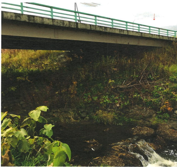
▲男能富橋の下を流れる23号川

河川占用許可を取得する事務が遅れたためです。今回は急を要するため、特別な許可を頂きました。