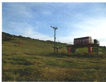
▲再開が決まったスキー場

町民にはスキー文化が根付いており、スポーツ振興や交流の場として重要な役割を果たす施設であり、予算に賛成する。