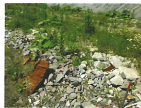
利用が増えない処理場

町 当初期待した町発注工事の搬入が少ないため、使用料改定や町外業者の受入れを検討予定。