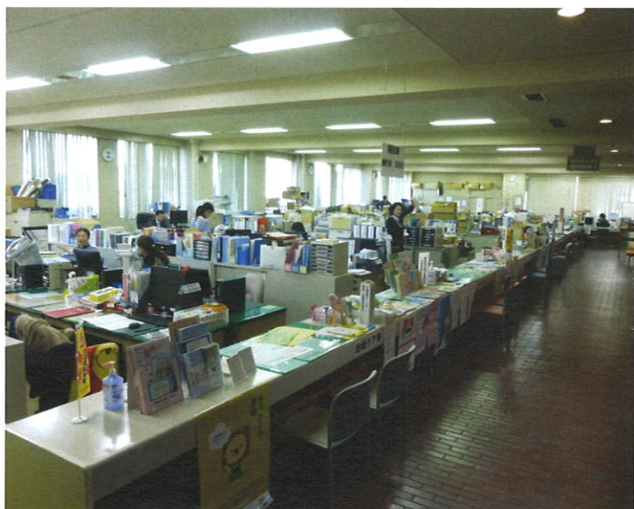
▲ 役場庁舎内の様子（1階フロア）

① 時間外の勤務は、条例で任命権者が命ずると規定されており、町長や教育長が命じています。実務的には課長が必要性を判断した上で手続きしています。 ② 係長以下の役職にある職員には時間外手当及び休日勤務手当があり、時間外は25%、祝祭日等は35%、深夜勤務は更に25%、各職員の1時間当たりの給与額に乗じた額が時間外手当単価となります。管理職は