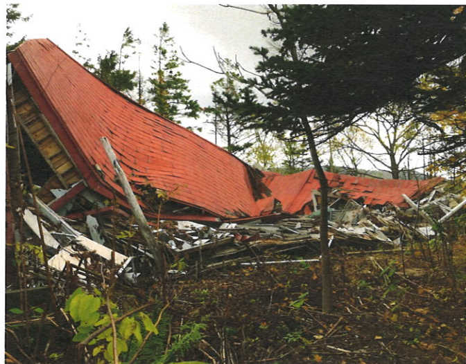
▲大雪により倒壊した旧幌萌小体育館

雄信内プール活用案は具体性に欠ける段階なので、今後町部局も含めて、協議の場を設けて検討、方針を出していきたいと思えます。