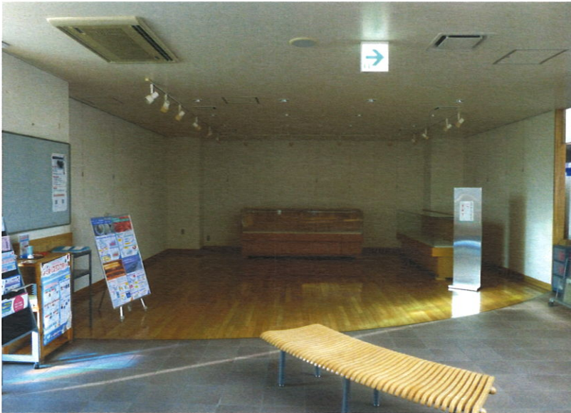
▲一向にリニューアルが進まない道の駅

補助金の関係から移動させる場合は関係機関との協議が必要です。観光協会との具体的な協議はこれからですが、使い方や使う人などを充分調整のうえ、有効に活用する方向で進めていきたいと思っています。