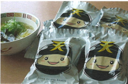
▲地場産品の充実を

地場産品が開発されることが望ましく、町民の方々に応援をお願いしたいと考えています。ルールを持って取り組む体制づくりを進めます。