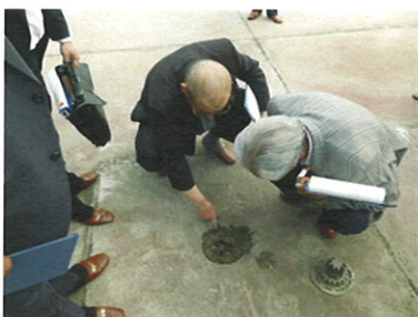
排水溝の詰まりを指摘

町 小学校は※指定緊急避難場所、指定避難所であり、屋上への避難も想定されるが、コーキング剥がれや排水溝の詰まりが発生している。