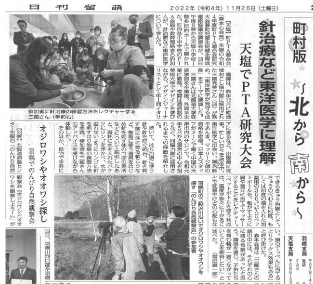
11月26日日刊留萌新聞掲載

こうした臨場感のある講演を通して、「鍼は痛いのか？」 「灸は熱いのか？」と誰もが思う疑問についてお答えし、医 療過疎地に暮らす人々に、東洋医学を身近に感じてほしい とお話しました。会場からたくさんの質問があり、とても 充実した時間になりました。