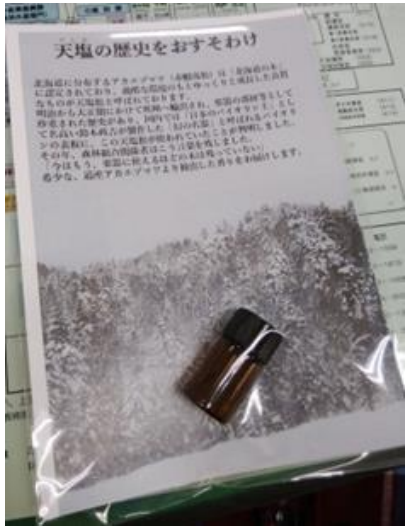
配布用ノベルティ

兵庫県神戸市にて天塩町ふるさと納税のPRを修学旅行中の天塩高校生と行いました。私が担当したのは、現地で配布する「アカエゾマツ・エッセンシャルオイル」の製造依頼からビジュアルまでの準備です。北海道の香りを神戸にお届けすることができました。