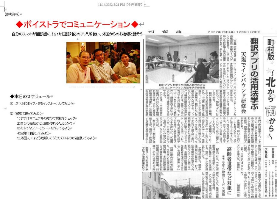
12月6日日刊留萌新聞掲載