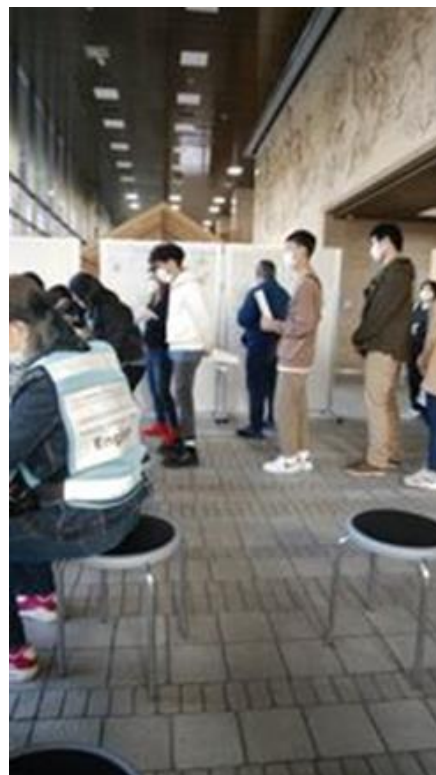
10月31日道庁にて研修