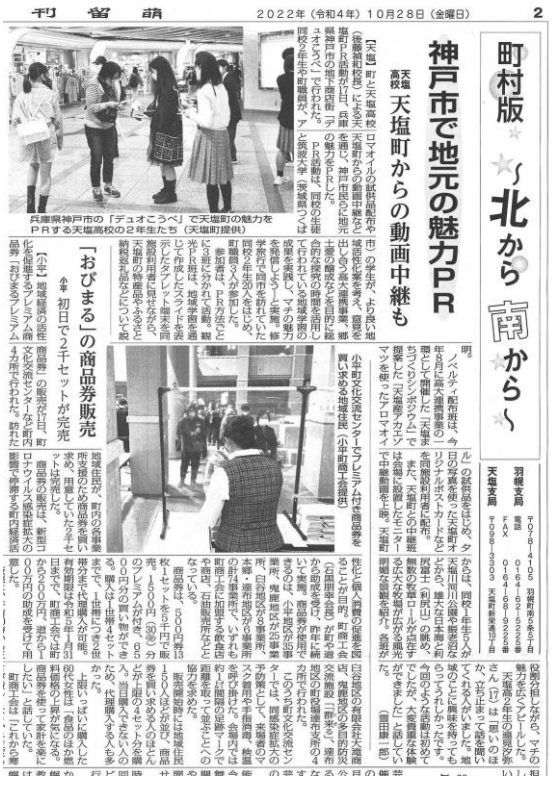
10月28日日刊留萌新聞掲載