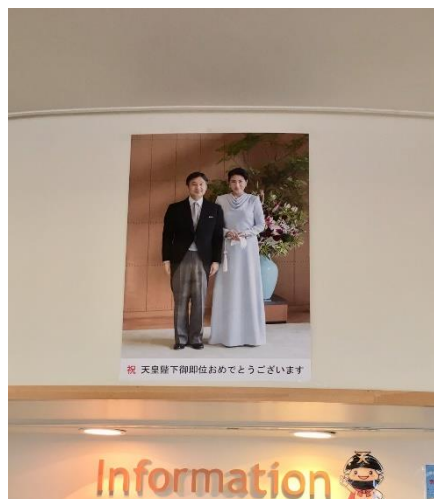
天皇陛下 記念写真を飾りました