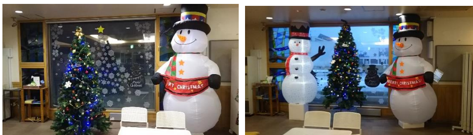
雪だるま高さ 2600×幅 1500 大サイズ