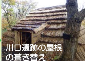
川口遺跡の屋根の葺き替え