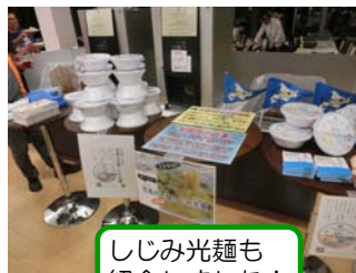
しじみ光麺も 紹介しました!

“いい川づくり” を実施している団 体が集まるワーク ショップに参加し て、天塩かわまち づくりの活動を報 告してきました!