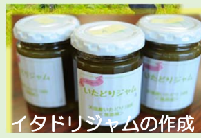
イタドリジャムの作成