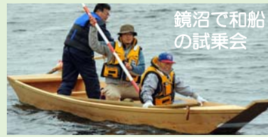
鏡沼で和船の試乗会