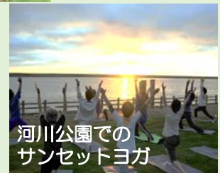
河川公園でのサンセットヨガ