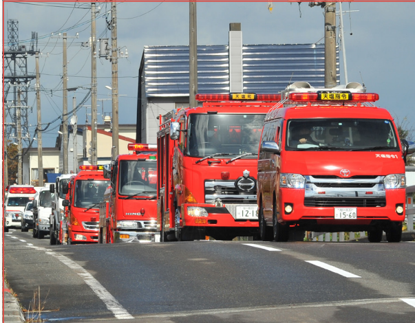
▼消防車両等による火災予防呼び掛けパレード

秋の全道火災予防運動が10月15日から31日までの17日間、実施されました。開始翌日の16日には留萌消防組合天塩支署の消防指令車を先頭に消防車3台、タンクローリー車2台、救急車1台など9台の隊列による車両パレードが市街地区を巡回して行われました。今回、統一防火標語「火を消して、不安を消して、つなぐ未来」のもと、「放火火災防止対策の推進」「製品火災の発生防止に向けた取組の推進」など6つの重点目標と「安全装置付きの火気使用器具及び消火器具の普及促進」などの具体的な推進項目を呼び掛けました。