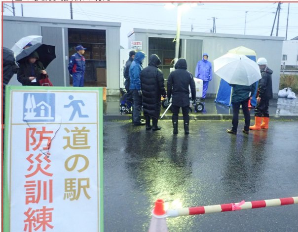
▼道の駅防災訓練の様子

道の駅「てしお」は令和3年6月に「防災道の駅」に選定され災害発生直後に一般利用者の安全の確保するためBCP（事業継続計画）を策定しています。11月6日、町主催による防災訓練が実施され道路管理者（北海道開発局留萌開発建設部、北海道（留萌振興局）、道路管理事業者、副町長ら関係者約30名が参加して行われました。訓練では「安否・建物等の被害状況の確認」「防災資機材倉庫に格納してある発電機や投光器の起動」「災害用マンホール・トイレキットの組み立て・設置」等の訓練を行い課題の洗い出し、意見交換などを行いました。