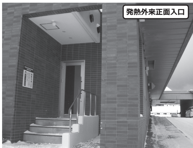
発熱外来正面入口