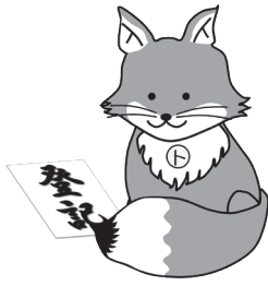
不動産登記推進イメージキャラクター「トウキツネ」