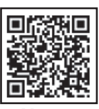
▲ X (旧 Twitter)