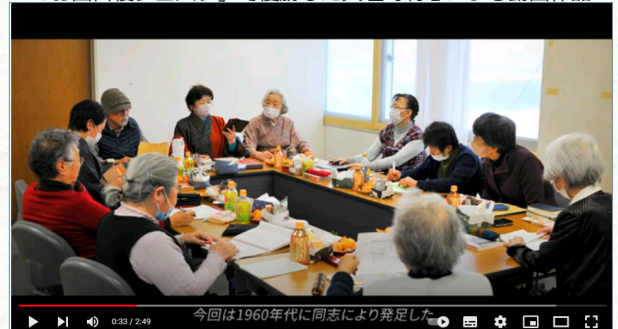
【日アラスカ姉妹都市・お国自慢フェスタ受賞作品】豊かな自然に囲まれ、季節の移ろい、感動を「俳句」表現する・天塩町 Haiku: Depicting the Rich Nature of Teshio