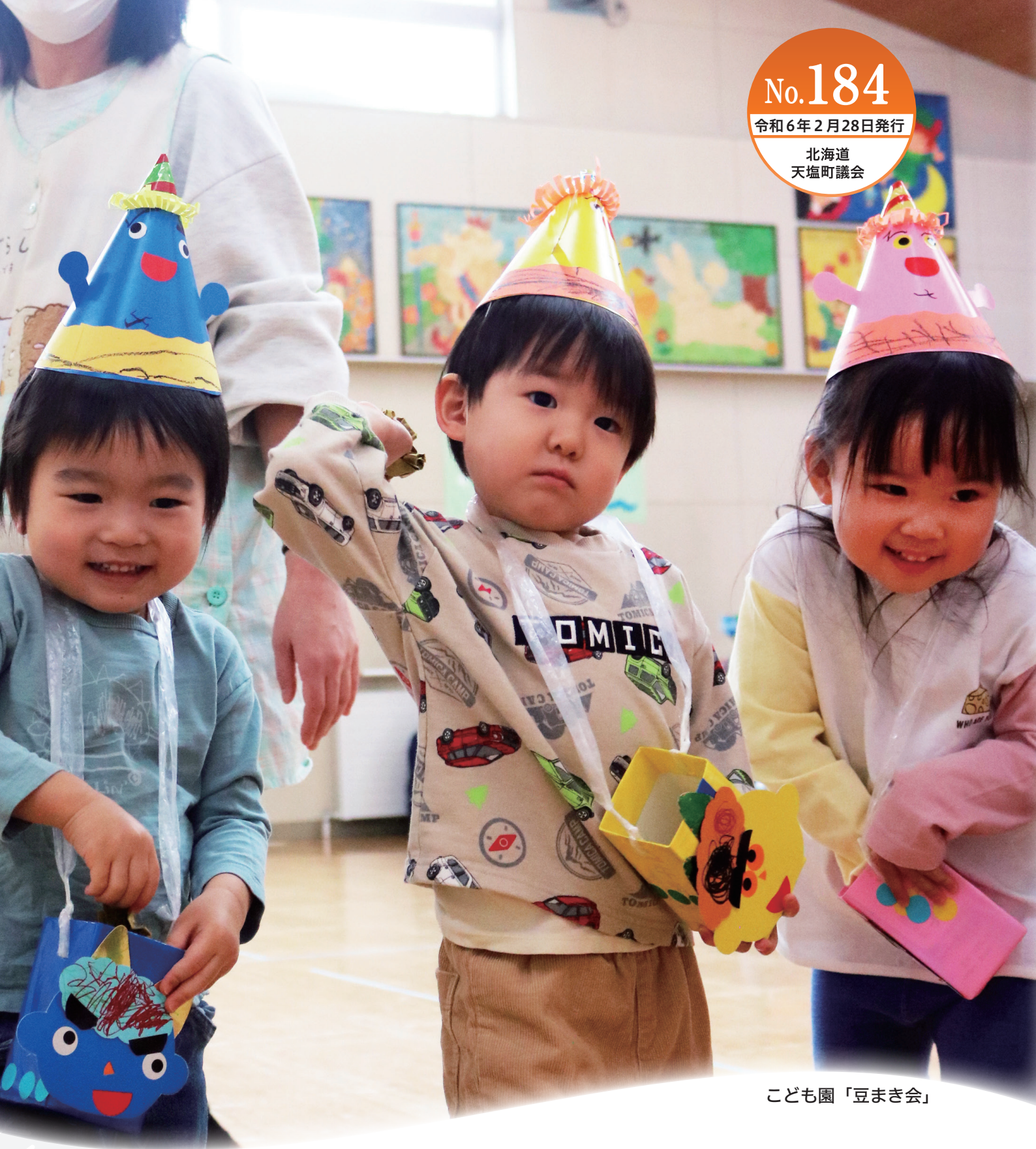
こども園「豆まき会」