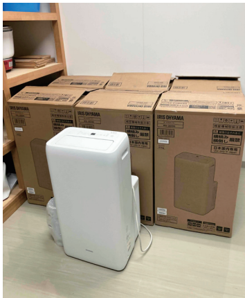
▲学校に設置されるスポットクーラー

働き方改革の視点では、いつも汗だくで働いている施設職員の方々や関係者を見ると大変苦労されていることは十分理解しております。今後そういった施設を少しずつ改善していきたいと思っております。