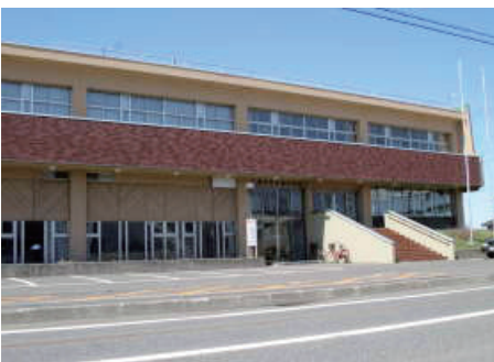
▲有効な利活用が求められる福祉会館事務所

りたいと考えております。 ③ てしお温泉夕映について、外壁や機械、電気設備など改修や更新時期を迎えていることから、大規模改修が必要と認識しております。雄信内生活改善センターについても、避難所機能、行政支所機能、コミュニティ事業を複合した新たな公共施設を整備しようと計画を進めております。