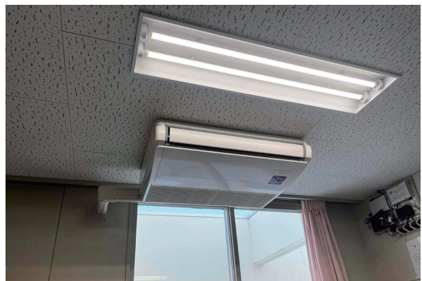
▲こども園職員室に設置されているエアコン