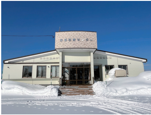
▲活用が期待される地域資源開発交流施設