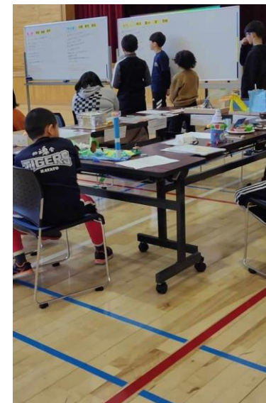
天塩小学校学習発表会