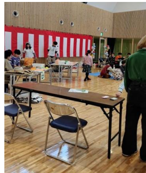
どさんこマーブルタウン (早来学園)