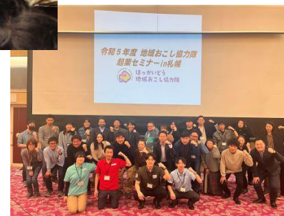
協力隊起業セミナー