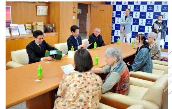
姉妹都市ホーマーからのお客様をおもてなし