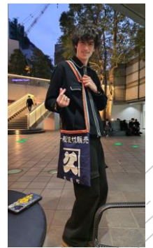
アメリカ人のアントンさん