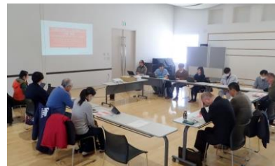
問寒別地区地域づくり懇親会