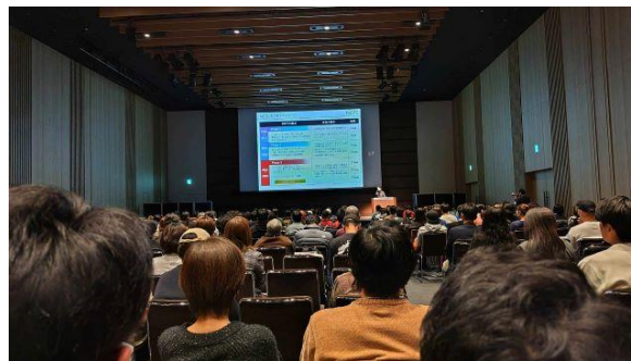
協力隊全国サミット