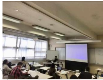
起業プランニングセミナー