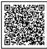
▲e-Tax についてはこちら

確定申告会場は大変混雑しますので、自宅等から申告書等の作成・提出をお願いします。国税庁ホームページの「確定申告書等作成コーナー」では、スマホやパソコンなどから申告書等を作成し、e-Taxで提出することができますので、是非ご利用ください。