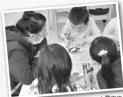
▲夢中で「てしお仮面」に好みの色をマーカーで塗る園児