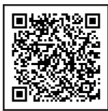
▲收受印の押なつについてはこちら

《開設期間》令和7年2月17日(月)から3月17日(月)まで 《相談受付時間》平日：午前9時から午後4時まで 《確定申告会場》稚内税務署(稚内市末広5丁目6番1号)