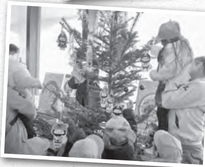
▲今だけの作品が並ぶ。すべてが天塩らしいイベントとなった