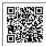
▲LINE公式アカウントはこちら

なお、2月13日(金)までの間、確定申告会場は開設されておりませんので、対応できる人数に限りがあります。税務署窓口での相談を希望される方はLINE又は電話による事前予約が必要です(事前予約をしていない方の申告相談は、受け付けておりません)。