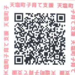
天塩町HP子育て支援紹介