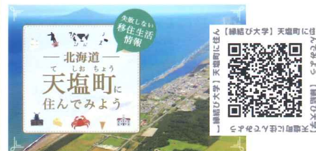
《縁結び大学》天塩町に住んでみよう