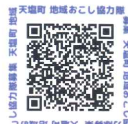
「地域おこし協力隊」募集