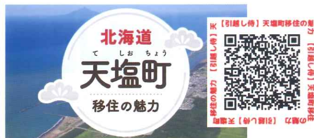
《引越し侍》天塩町移住の魅力