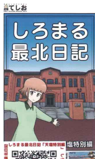
しろまる最北日記 天塩特別編