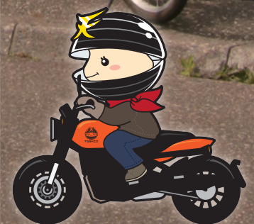
シン・ライダーハウスオープン [5月1日]