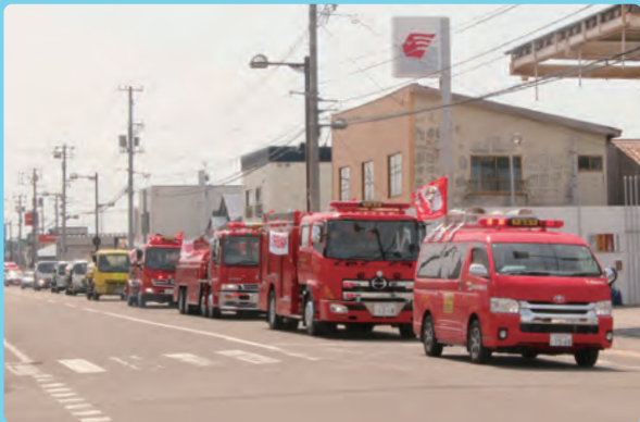
▲新栄通を通過する車両パレード

4月20日から30日まで、春の全道火災予防運動が実施されました。春は空気の乾燥や強風により火災が発生しやすく、また行楽シーズンを迎え山に入る人が増えることや農作業に由来する枯草焼きを原因とした林野火災の発生件数も多い時期となっています。初日の20日には恒例の車両パレードが行われ、消防指令車を先頭に消防車、危険物安全協会の天塩支部のタンクローリー、パトカー、救急車など11台が車列を組んで天塩・雄信内市街地を走行し、火災予防を呼びかけました。