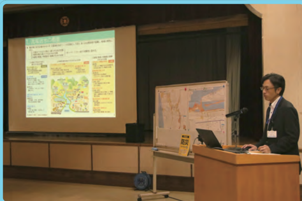
▲流域治水について説明する様子

町では、今年3月に改定されたハザードマップを有効に活用していただくため「ハザードマップ説明会」を5月13日に開催しました。前半は住民課より内容の変更点や活用方法の説明、後半は留萌開発建設部より流域治水の取り組みと町内での水害リスク、水害時における個人の防災行動計画を整理する「マイ・タイムライン」について説明されました。ハザードマップは全戸配布されていますので、お住まいの場所の被災可能性や、災害の種類に応じた避難場所と避難経路を必ず確認して、災害への備えとしてください。