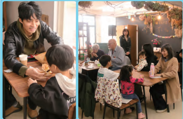
▲ハンバーガーなどを楽しむ人で賑わうカフェ内

4月11日、サニースペース（海岸通4）で恒例のコミュニティカフェ「Te to Te+（テトテプラス）」が開催されました。今回は中川町の「JUNGRY MAN」が出店し、中川牛100%のパティを使用したハンバーガーを販売。最大風速16mの強風が吹き荒れる悪天候にも関わらず、カフェ内はこだわりのハンバーガーを求めてきた人々で賑わい、お昼を過ぎた頃には完売となりました。「Te to Te+」では毎回様々な企画を行っており、6月には昨年好評だった鏡沼でのカヤック体験が行われる予定です。